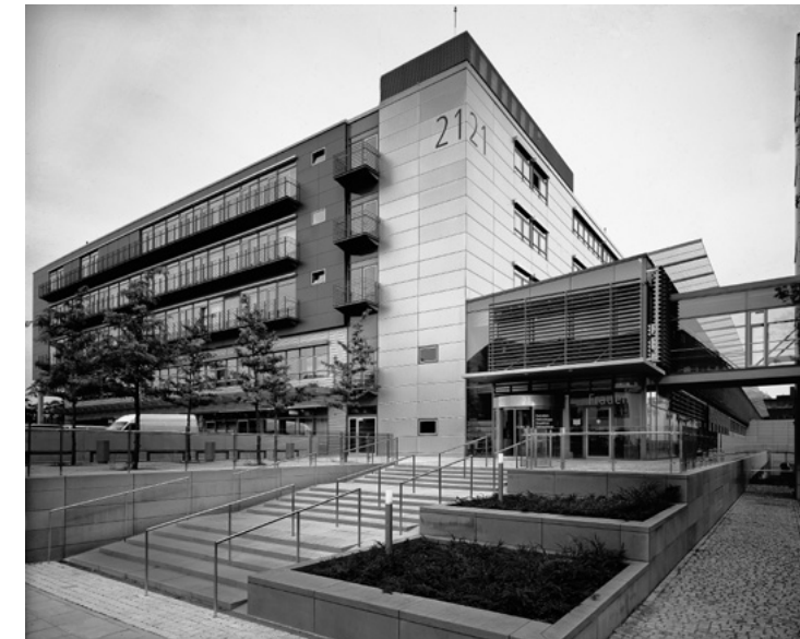
Universitätsklinikum Carl Gustav Carus Dresden Klinik und Poliklinik für Kinder- und Jugendmedizin